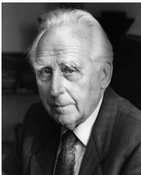
Gerhard Ebeling, erster Leiter des Instituts, im Winter 1989.

Bald wird das Institut für Hermeneutik und Religionsphilosophie fünfzig Jahre alt: Durch Beschluss vom 12. April 1962 gab der Regierungsrat des Kantons Zürich dem Antrag der Theologischen Fakultät statt und bewilligte die Errichtung eines Instituts für Hermeneutik auf den 1. Mai desselben Jahres. Erster Leiter wurde Gerhard Ebeling, damaliger Professor für Systematische Theologie, der die Idee dieses Instituts in der Fakultät auch angeregt hatte.