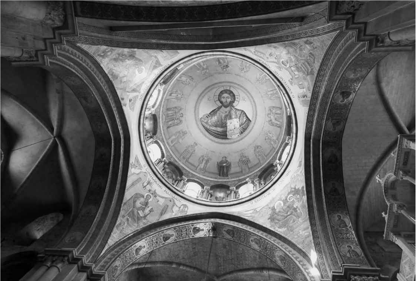
Jesus Christus, der Herr der Kirche. Pantokrator (griech. Allherrscher) in der Kuppel der Jerusalemer Grabeskirche.

Man kann den Einschluss und Ausschluss von Menschen(gruppen) distanziert beschreiben. Jede Gesellschaft hat ihre Inklusions- und Exklusionsmechanismen. Versteht man Inklusion hingegen normativ als kontrafaktisches Handeln gegen das Gefälle quasi «normaler» Ausgrenzungspraxis, wird das religiöse – oder besser: evangelische Profil erkennbar. Was geschieht, wenn ein Mensch diejenigen segnet, die ihn verfluchen? Oder was geschieht in einer Gemeinschaft von Unterdrückten, wenn einer, der mit der Besatzungsmacht kollaboriert, nicht verdammt wird? Wenn also Umkehr, Vergebung und Versöhnung als Handlungsoptionen ins Spiel kommen? Wenn einem Menschen der Himmel versprochen wird, den alle zur Hölle wünschen? Wenn einer Frau, die eigentlich aus der Gemeinschaft ausgeschlossen werden müsste, weil sie untreu war, nicht die Leviten gelesen werden, sondern in Anwendung von Leviticus