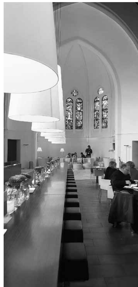
Das Bielefelder Kirchenrestaurant «Glückundseligkeit».

Meine am Zentrum für Kirchenentwicklung entstehende Dissertation soll die Nutzung kirchlicher Orte und Räume im urbanen Raum ausloten und anhand erfolgreicher Konzepte zur erweiterten Nutzung das Potenzial dieser Räume aufschlüsseln. Dieser Fragehorizont verweist unmittelbar auf die unterschiedlichen Bedeutungszuschreibungen, die Kirchengebäude als machtvolle öffentliche Symbolisierung von Religion erfahren und die nur multiperspektivisch erschlossen werden können. Ausdruck dieser vielfältigen Zugriffe auf den Kirchenraum stellen seine diversen Funktionen dar. So ist ein Kirchenraum primär ein Raum, der dem gottesdienstlichen Feiern gewidmet und somit auch liturgischer Raum ist. Zudem fungieren Kirchenräume als öffentliche Zeugnisse der Baugeschichte, die architektonische, historische und kulturelle Werte und Praktiken vergegenwärtigen. Im öffentlichen Diskurs über kirchliche Räume ganz besonders virulent ist seine Funktion als Ort individueller religiöser Er-