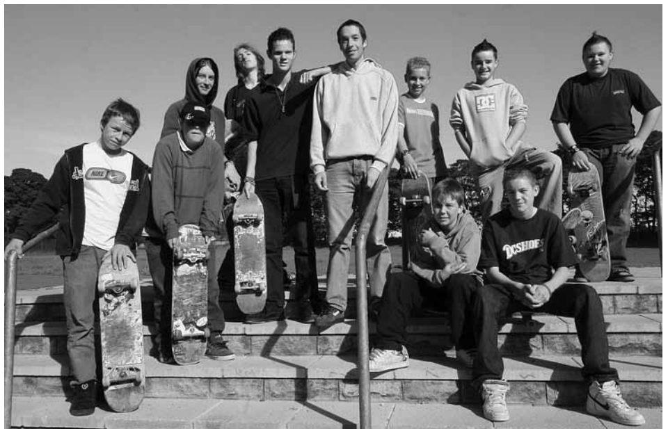
Sorted: Jugendkirche im Skater Park.