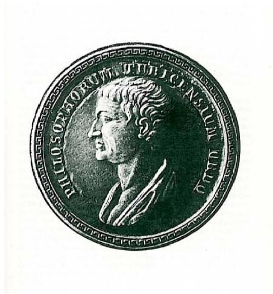
Abb. 4 Das Siegel der philosophischen Fakultät der Universität Zürich mit der Umschrift PHILOSOPHORUM TURICENSIVM ORDO

Wahl eines Bildes von Aristoteles für das gemeinsame Siegel: Die Naturwissenschaften des beginnenden 19. Jahrhunderts sind im deutschen Sprachraum – im Unterschied zu Frankreich und England – stark von naturphilosophischen Gedanken geprägt. 29