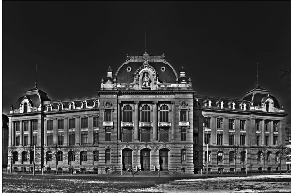
Abb. 1 Das Hauptgebäude der Universität Bern mit der Inschrift UNIVERSITAS LITTERARUM BERNENSIS 2

Eine Universität vereint viele, einzelne, verschiedene Gelehrte und Studierende und sie verbindet viele, einzelne, verschiedene Wissenschaften. Das Widerspiel der Kräfte ist ihr inhärent. Indessen habe ich den Eindruck, dass in den letzten Jahrzehnten die Spannungen sich mehren und verschärfen, auf jeden Fall sich deutlicher artikulieren. 3