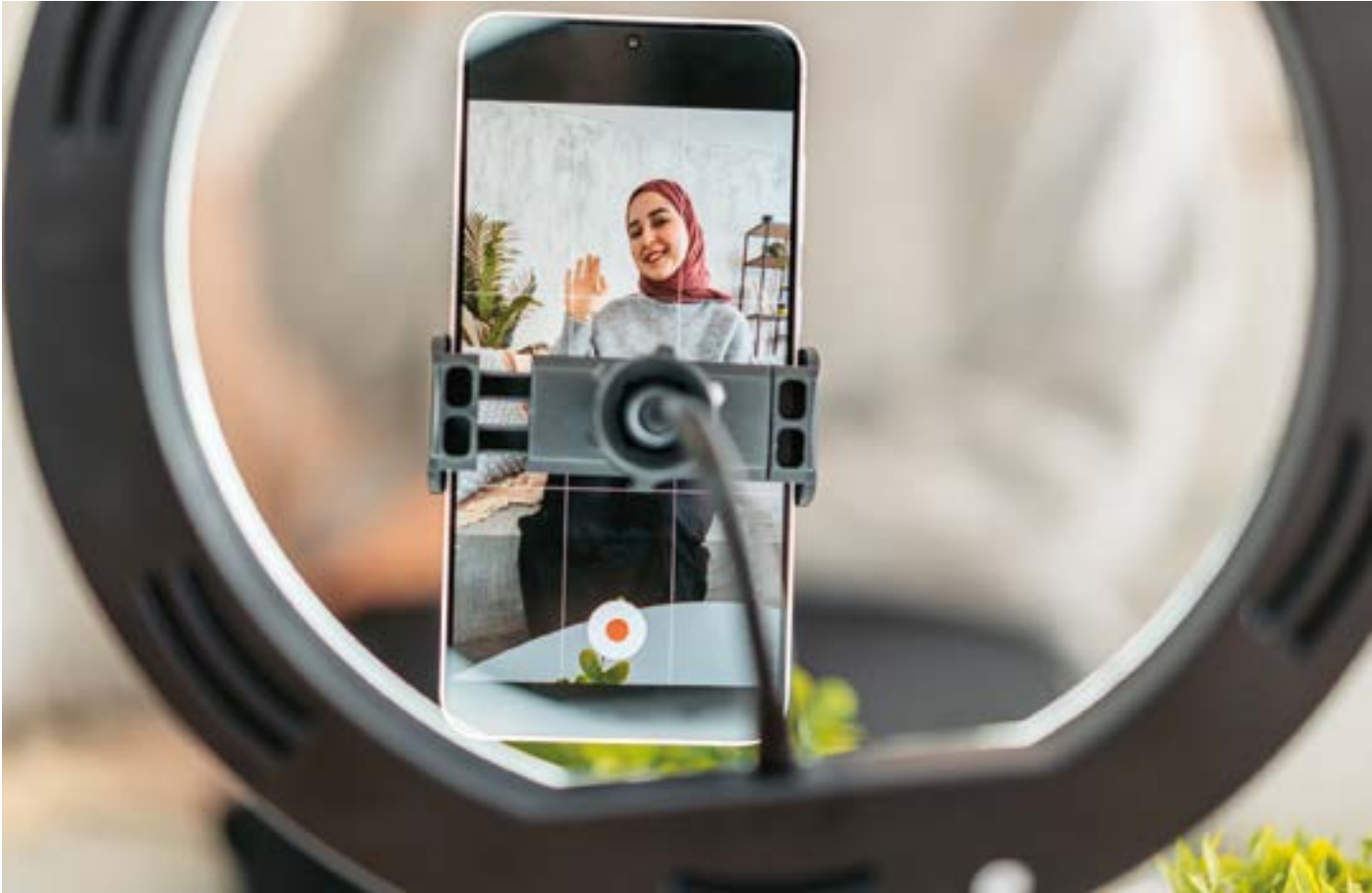
Religiöse Entrepreneur:innen – wie z. B. muslimische Lifestyle-Influencer:innen – können dadurch etablierte Deutungen religiöser Autoritäten infrage stellen, Diskussionen anregen und die Vielfalt innerhalb muslimischer Lebenswelten sichtbar machen.

Vertrauen erst aufgebaut werden. Das erklärt, weshalb Entrepreneur:innen ihre Legitimität und Qualifikation häufig mithilfe von Kund:innenzahlen, Testimonials, Tätigkeitsjahren oder ihrer eigenen Biografie zu belegen versuchen.