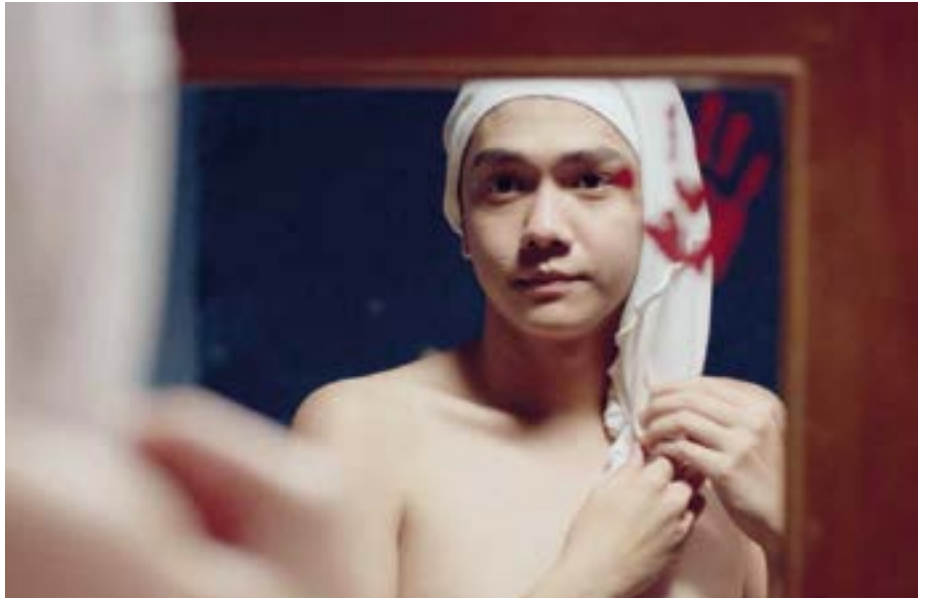
Im Kurzfilm «Pria» wird deutlich, welche Belastungen und Ressourcen mit Intersektionalität verbunden sein können. (Bild: Standbild aus «Pria», IndieFlip/Babibutafilm)

also ein Aspekt der Identität, manchmal ein anderer. Und diese Gewichtung verändert sich – nicht nur im eigenen Selbstverständnis, sondern auch im Blick von aussen.