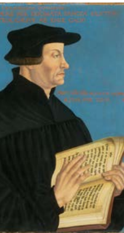
Huldrych Zwingli (Hans Asper, 1549).

Was nun folgte, haben mehrere Zeitgenossen sichtlich beeindruckt beschrieben: Zunächst wurde ein Abschnitt des Buches Genesis in der allgemein üblichen lateinischen Übersetzung verlesen. Sodann erhob sich Ceporinus, las den gleichen Text in seiner hebräischen Grundsprache vor und bot eine eigene lateinische Übersetzung, in die er Informationen zu Vokabeln und Grammatik einflocht. Es folgte erneut Zwingli: Er verlas die gleiche Passage in der «Septuaginta», der antiken griechischen Übersetzung des Alten Testaments, übersetzte diese ebenfalls ins Lateinische und erläuterte den Text ebenfalls. Dabei ging er über rein sprachliche