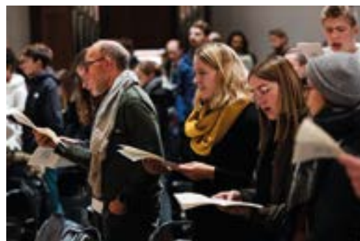
Evensong im Fraumünster.